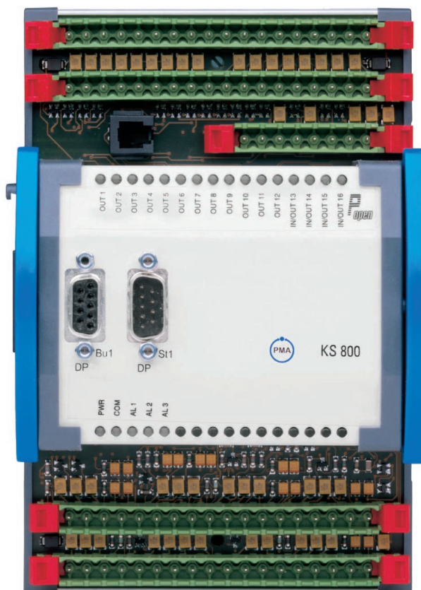
Bild 1: KS 800 Multitemperatur-Regler / Fig.1: KS 800 multi-Temperature controller

Especially with 3-layer foamed pipe extrusion, exact temperature control is a prime factor for the product's properties. The KS 800 controllers ensure the necessary precision and stability for all the heating and heating/cooling zones. For this, the control parameters must be matched precisely to the loop conditions. At the push of a button, the standard self-tuning function of the KS 800 determines the optimum settings, e.g. after a step change (start-up), whereby even the mutual effects of neighboring heating zones of mould and extruder are taken into account.